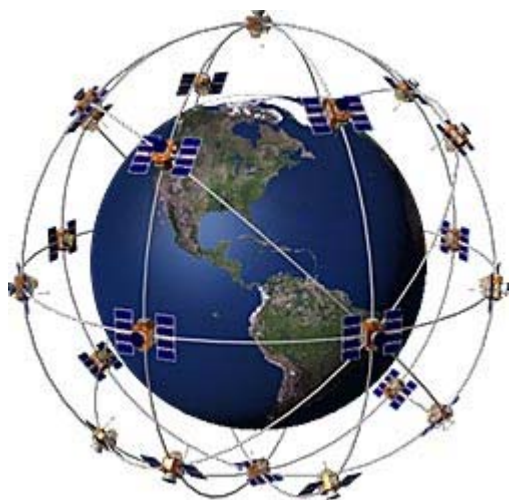
Figur 2 Satelliter som roterar 2 varv runt jorden per dygn och sänder ut information om identitet, tid, och position utgör grunden i GPS systemet.

Det finns ett antal olika system för positionsbestämning, triangulering i cellulära nät, GPS, GLONASS, Galileo (i drift 2010), m fl. Satsafe använder GPS systemet, som är det mest utbyggda och har störst global täckning. GPS systemet består av 29 satelliter som cirklar i banor runt jorden och sänder ut tre typer av information som används av mottagarna för att räkna ut den egna positionen. Det behövs kontakt med minst 3 satelliter för att beräkna en position. De flesta satellitmottagare kan dock ta emot signaler från 12 eller fler satelliter samtidigt. Detta ger en högre noggrannhet. Teoretiskt kan positionen bestämmas med en precision på under en meter, även om de flesta kommersiella GPS mottagare ger en noggrannhet på cirka 15 meter.